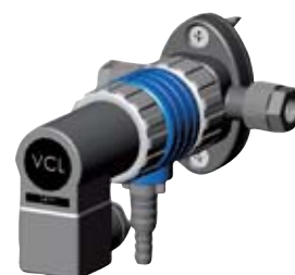
VCL-B 10 A1