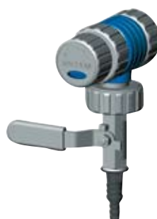
VCL 02 A1