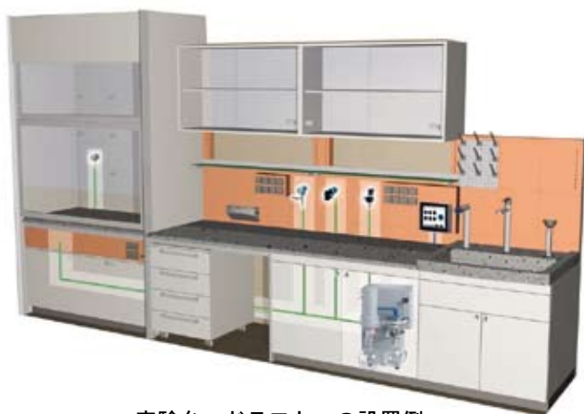
実験台、ドラフトへの設置例

バキューランは、真空ポンプと真空コックを PTFE 配管でネットワーク状に接続したシステムです。真空ポンプ1台で、エバポレーターをはじめとする複数の真空機器を同時に減圧可能です。ユニットには、それぞれ逆止弁を内蔵していますので、異なる真空機器相互の干渉がほとんど無く、使用中に他のバルブを開いても他系統の真空度に影響がほとんどありません。設置も簡単ですので実験台単位の真空ライン構築などに最適です。Mini-Network は、ニードルバルブが予め3個セットされ、実験台やドラフトのスタンドに取り付けることで簡単に3系統のバルブシステムが設置できます。