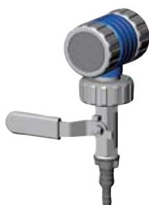
VCL K A1