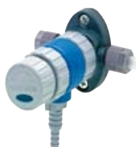
VCL 01 A1